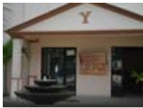
LODGE DES ALMADIES

Route des Almadies, Tél.: (+ 221) 33 869 03 45